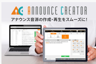
アナウンスクリエーター