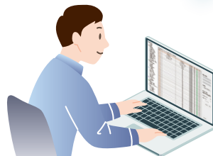
非常用放送設備 設定支援ソフトウェア