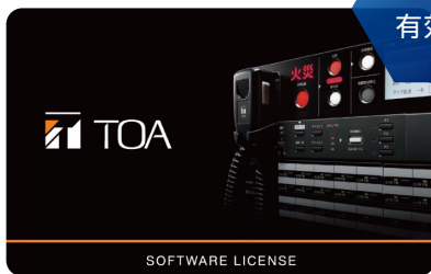
音声合成拡張ライセンス FS-25SL-M20 FS-25SL-M100