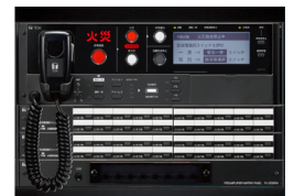
非常用放送設備 FS-2500シリーズ FS-A2500シリーズ