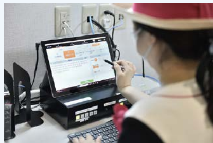
インフォメーションセンター