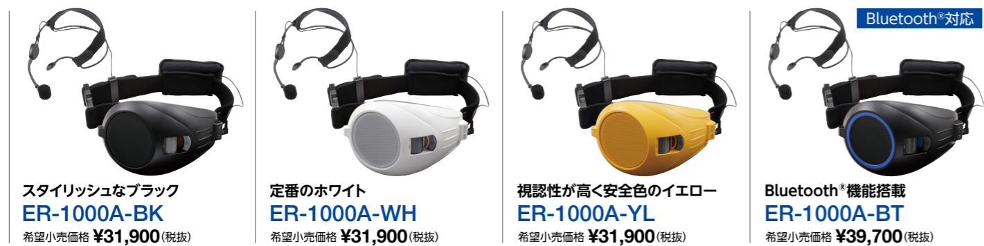
スタイリッシュなブラック ER-1000A-BK 希望小売価格 ¥31,900 (税抜)