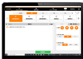
アナウンスクリエーター