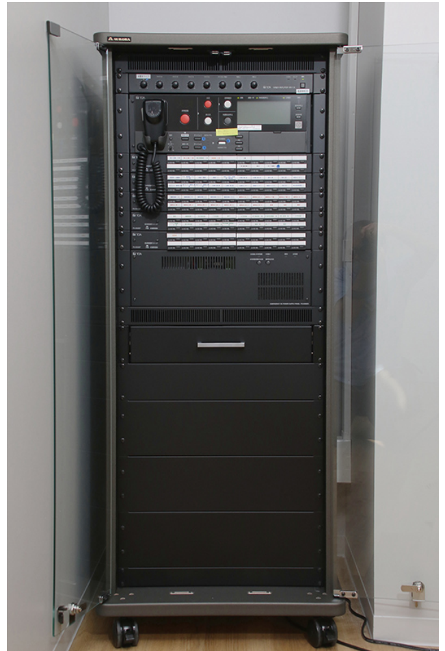
厚生研修棟「CROSS BASE」3階会議室の非常用放送設備。タイマーで始業前のBGM放送が流されるほか、朝8時からリモートマイクによる朝礼放送を流している。