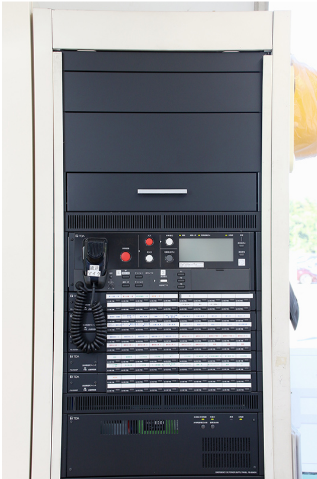
保安室にある非常用放送設備のリモコン架。ここから工場全エリアに放送を行うことができる。