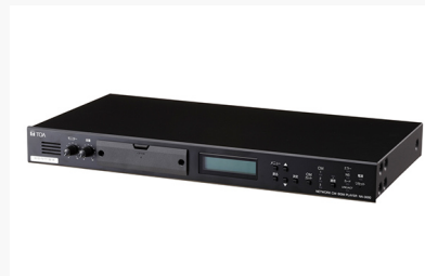
ネットワークCM・BGMプレーヤー NA-3000