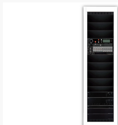
ラック型非常用放送設備 FS-2500シリーズ