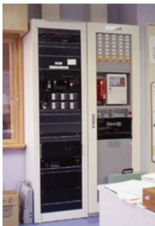
受付を兼ねた事務室に設置された非常・業務用放送設備ラック