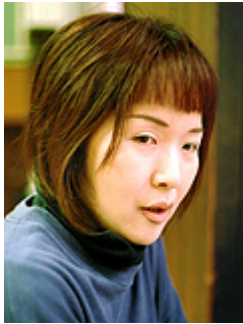
振付家・ダンサー（ナビゲーター、ダンサー）